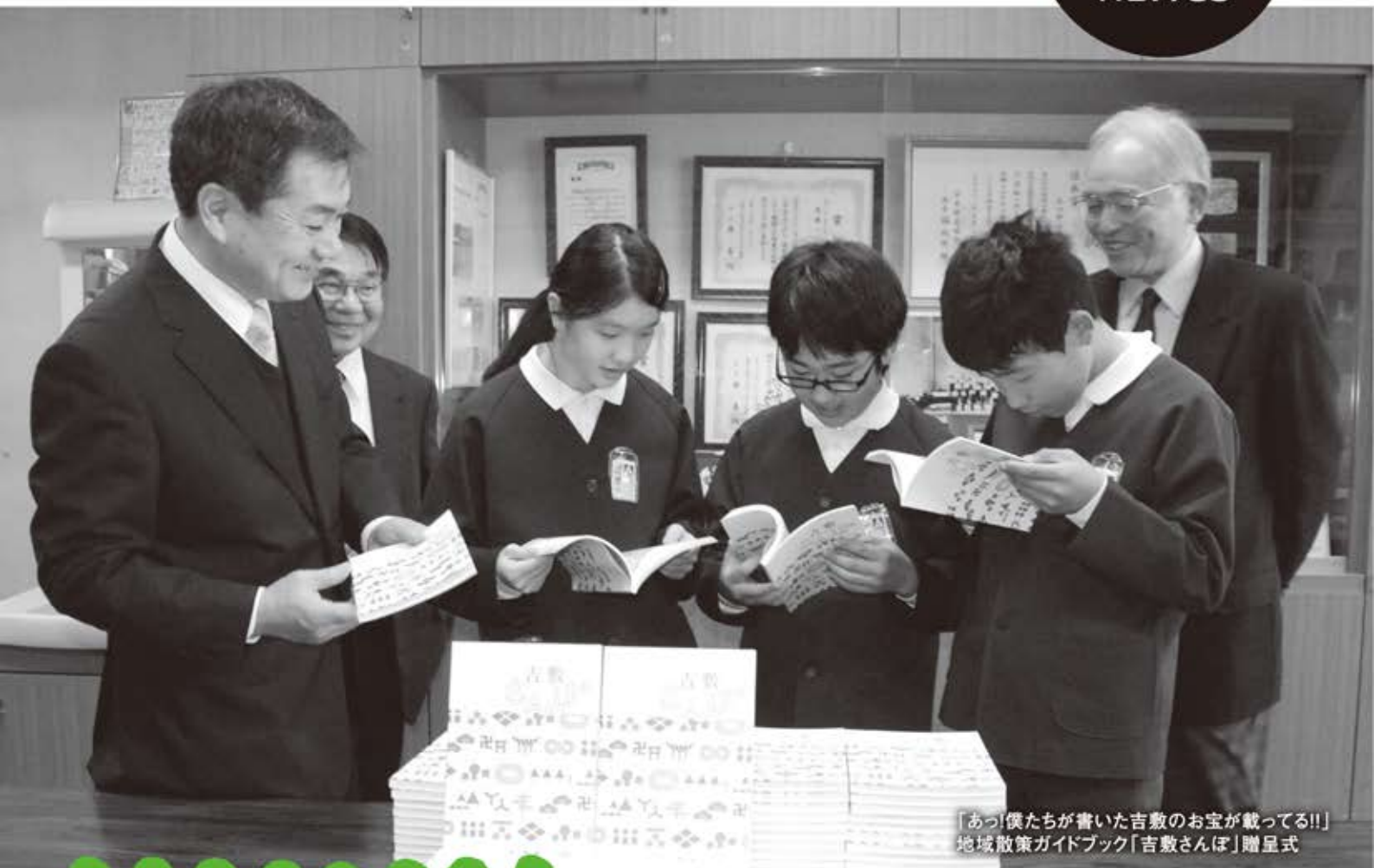
「あつ!僕たちが書いた吉敷のお宝が載ってる!!」 地域散策ガイドブック「吉敷さんぽ」贈呈式