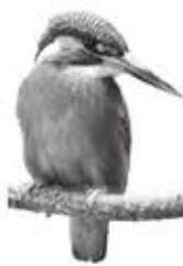
【カワセミ(カワセミ科)】 「吉敷さんぽ」には、吉敷の自然を、オホカワセミ(カワセミ科)の一種であるカワセミの姿が、写真とイラストで紹介されています。カワセミは、川や池に生息する鳥で、水辺に近づくと、水面に反射した光を、鋭い目で見つめます。カワセミは、川や池の生態系の中で、重要な役割を果たしています。

I章「ハツと見る・ザツと知る」では、吉敷にどのようなものがあるのかハツと見てザツと知ることができるよう、自然や文化などを分類・整理して紹介しており、内容も写真主体の分かりやすいものになっています。