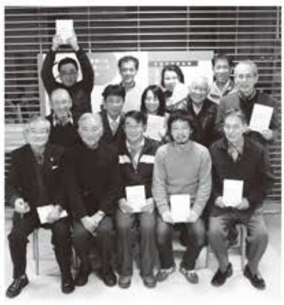
編集に携わった仲間たち

新しいメンバーを募集しています。私たちの暮らす吉敷地域で、ともに文化活動を進めていきませんか。「問い合わせ」吉敷ふるさと文化振興委員会 083-922-3344