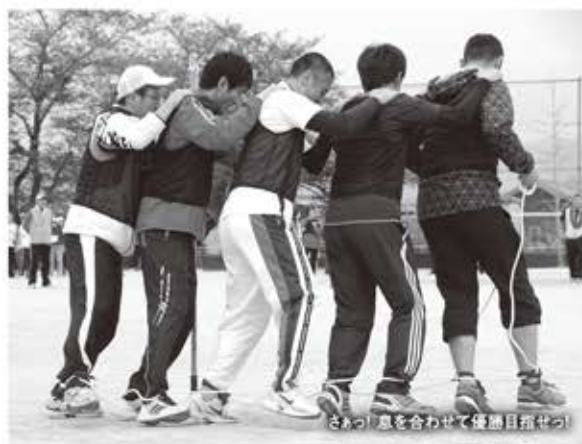
さあ、息を合わせて優勝目指せっ！