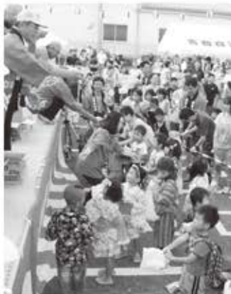
昨年の夏まつりの様子

行事日程は変更する場合があります。右記行事の詳しい内容や、その他の行事については、随時、広報紙等でお知らせします。