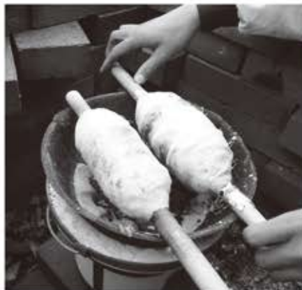
バームクーヘン作りにも挑戦しよう！

今年は七輪を使ってバームクーヘン作りなどもやりますよ！ぶちアウトドアをみんなで楽しみましょう！