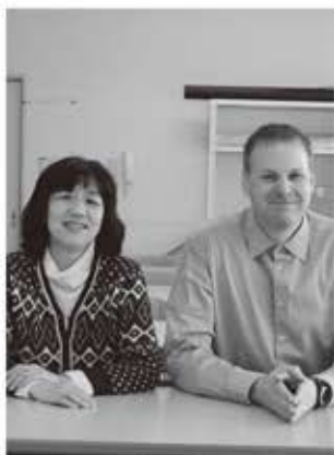
友森先生とブライアン先生