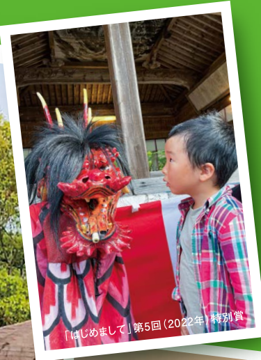
「はじめまして」第5回(2022年)特別賞