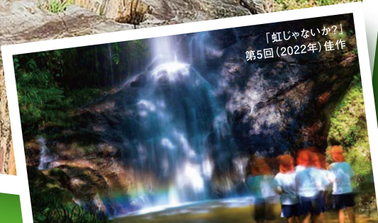
「虹じゃないか?」第5回(2022年)佳作