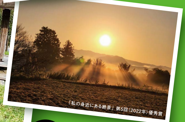
「私の身近にある絶景」第5回(2022年)優秀賞